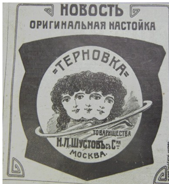
Рэклама з часопіса “Нива” з фондау ДУ “ГКМЗ “Заслауе”, пачатак ХХ ст.