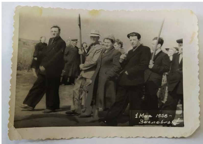
Дзень працы – 1 мая 1956 г., група лекараў; фота з фондаў ДУ "ГКМЗ "Заслаўе"

Хоць фотаздымкаў 1950-1960-х гг. з выявай краявідаў Заслаўя і партрэтамі яго жыхароў захавалася не надта каб і шмат, але смела можна казаць, што іх маецца нашмат больш, чым за ўсю палову стагоддзя (1900-1950), якая папярэднічала гэтаму часу. Дарэчы, тут трэба зрабіць