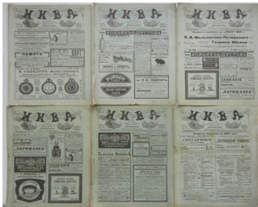
Часопісы “Нива” з фондаў ДУ “ГКМЗ “Заслаўе”, пачатак XX ст.