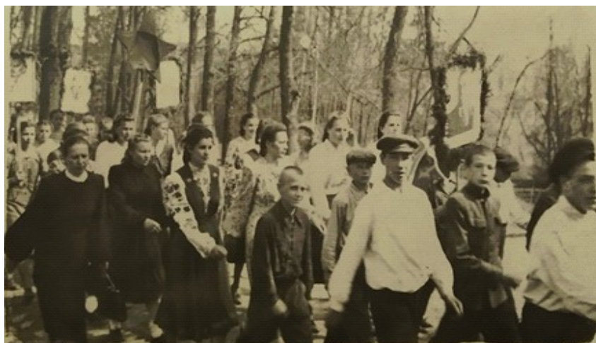
Дэманстрацыя, з самаробнай зоркай; фота з фондаў ДУ "ГКМЗ "Заслаўе"

Датычна Заслаўя трэба зрабіць асобную заўвагу наконт справы фотаграфавання, якая на пэўны перыяд была тут даволі значна абмежавана. З 1921 па 1939 гг. Заслаўе было памежнай тэрыторыяй з Польшчай, з 1924 г. тут існаваў 15-ы (Заслаўскі) памежны атрад войскаў НКВД, разнастайныя аб'екты ваеннай інфраструктуры, таму свабодна фотаграфаванне тутэйшых ваколіц (краявіды) было забаронена, гэта магло быць прынята за шпіянаж і цягнула б за сабой вельмі сур'ёзную адказнасць. Аднак, гэта не накладала забароны на прыватныя фотаздымкі партрэтнага кшталту, на якіх, напрыклад, выяўляліся выхаванцы дзіцячых грамадскіх устаноў, сямейныя партрэты, фотаздымкі у інтэр'еры хаты або ў двары. Таму можам казаць, што фотаздымкі тым часам у Заслаўі рабіліся, але ў вельмі малой колькасці, пра тое, што карыстанне прыватнымі фотаапаратамі ў памежнай зоне жорстка рэгламентавалася [1].