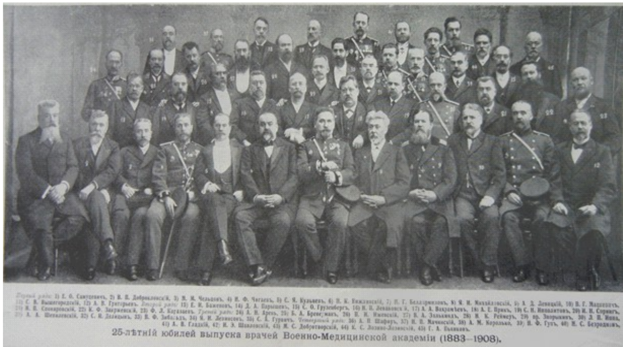
Фотаілюстрацыя з часопіса “Нива”, пачатак ХХ ст.

За всю историю журнала “Нива” мир увидел 2,5 тысячи его номеров и более 50 миллионов бесплатных приложений. Он стал, наряду со своими приложениями, занимательным “чтивом” для миллионов людей, поспособствовал развитию кругозора миллионов читателей, стал основой многих домашних библиотек. Просуществовав почти полвека, данное