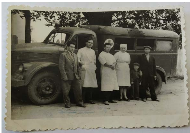
Брыгада хуткай дапамогі Заслаўскага раёна, 1950-я гг.

фотапаперу. Гэта дало магчымасць зрабіць да 1950-1960-х гг. набыццё фотаапарата і патрэбных для яго выкарыстання матэрыялаў больш даступным для звычайнага грамадзяніна, хаця тут жа варта адзначыць і тое, што якасны фотаапарат таксама каштаваў не зусім танна, але, параўнальна з ранейшым часам, значна танней. Працягвалі сваю працу і спецыяльныя фотаатэлье, дзе можна было замовіць патрэбныя фотаздымкі, а таксама, пры нежаданні або немагчымасці зрабіць праяўку ўласнай плёнкі самастойна, замовіць праяўку гэтай плёнкі і, заплаціўшы за яе, атрымаць гатовыя фотаздымкі.