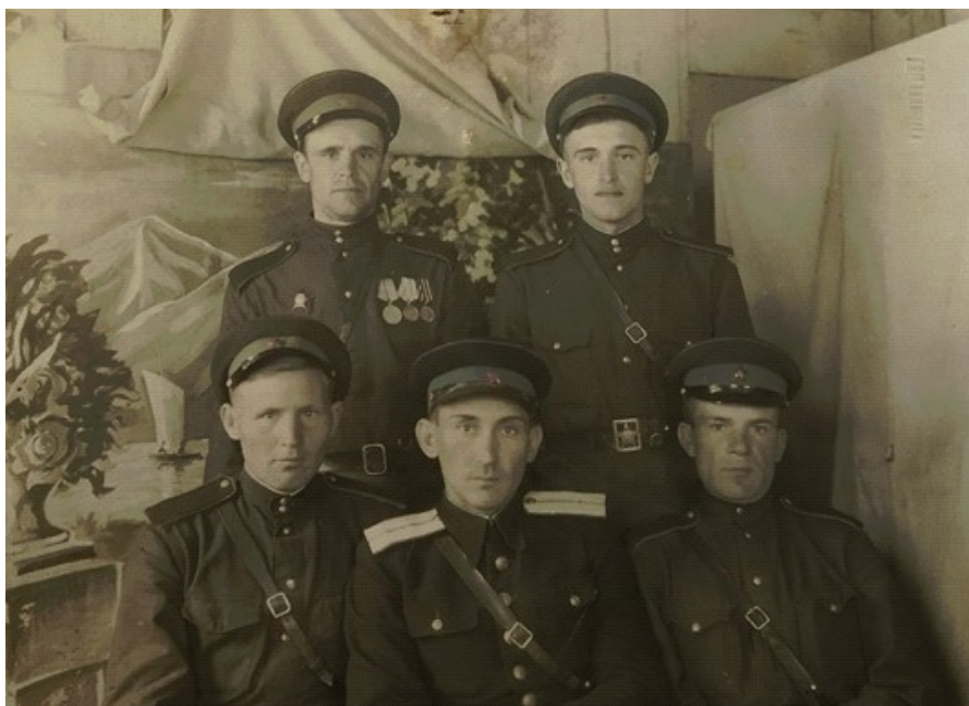
Заслаўскі аддзел міліцыі, 1950-я гг.

Згодна з меркаваннем галоўнага захавальніка фондаў ГKMЗ “Заслаўе” А.К. Рака, фотаатэлье ў Заслаўі ў канцы XIX-пачатку XX стст., на жаль, не існавала. Таксама ён мяркуе, што жыхары мястэчка тады не мелі на руках уласных фотаапаратаў, што выглядае цалкам праўдападобным [1].