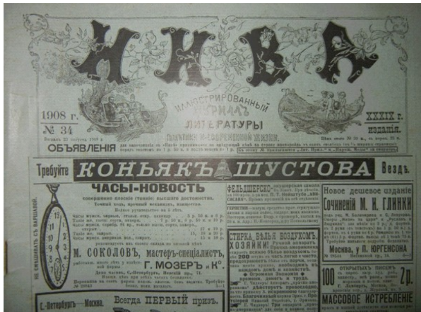
Фрагмент вкладки часопіса “Нива” з фондау ДУ “ГКМЗ “Заслауе”, пачатак ХХ ст.

Основателем журнала “Нива” был Александр Фёдорович Маркс, который стремился все прибыли от продаж вкладывать в дальнейшее развитие журнала и благотворительность. После смерти А.Ф. Маркса остался капитал в 500 тысяч рублей. Вся эта сумма была завещана им перед смертью на нужды благотворительности.