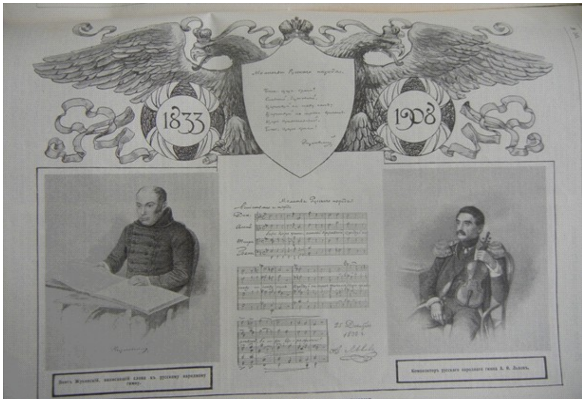
Ілюстрованія матэрыялы з часопіса “Нива” з фондаў ДУ “ГКМЗ “Заслаўе”, пачатак ХХ ст.