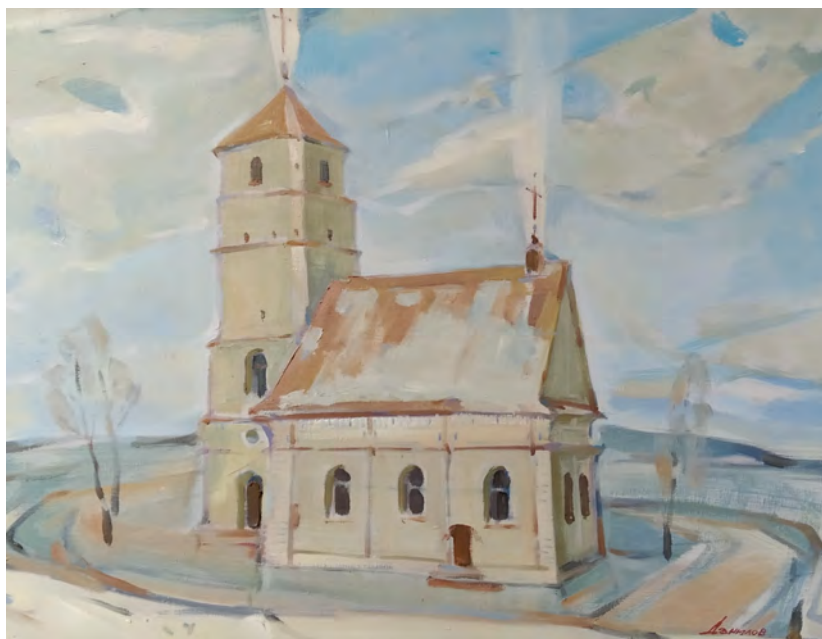
Віктар Данілаў, “Заслаўе. Спаса-Праабражэнская царква”, 2015 г.; памеры крыху зменены, у выніку тэхнічнай абрэзкі выявы

сэрцам любоўю да яе прыроды і гісторыі, а найбольшую частку гэтай любові захапіла менавіта Заслаўе, што нельга з прыемнасцю не адзначыць. Цяжка адразу падлічыць, колькі ім было створана карцін заслаўскай тэматыкі, але дужа багата, і алеем, і акварэллю пісаных.