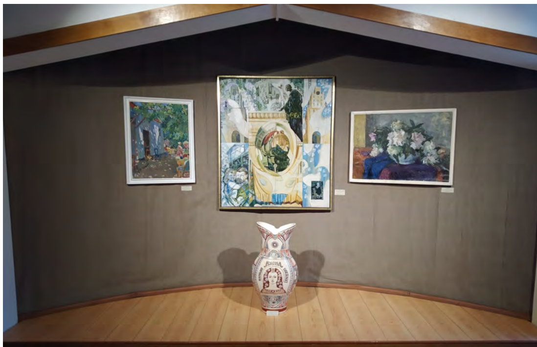
Выстава “Жывая памяць аб вайне” ў музейна-выставачным комплексе

У Дзень Перамогі варта згадаць Герояў, якія са зброяй у руках змагаліся супраць нямецкіх захопнікаў і іх памагатых, згадаць мірных ахвяр, што пагінулі ў карных аперацыях, аблавах, канцэнтрацыйных лагерах, пад час баявых дзеянняў... Памяць – лепшая наша ўдзячнасць за стойкасць і мужнасць продкаў, памяць – лепшы спосаб выказаць жаль аб тых, хто пакінуў гэты свет у жахлівых пакутах.