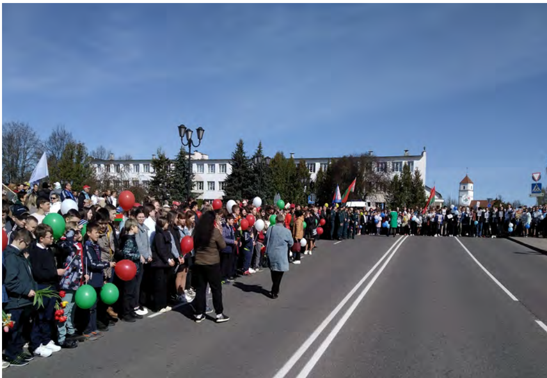
Мітынг на плошчы перад гарвыканкамам, Заслаўе, 9 мая 2022 г.

Нашы супрацоўнікі ўдзельнічалі ў гарадскім свяце “Дзень Перамогі” – у мітынг, ускладанні кветак да мемарыялаў, якія адбываліся 9 мая ў Заслаўі. Апрача таго, музей-запаведнік у гэты святочны Дзень арганізаваў бясплатны прыём наведвальнікаў, каб і нам зрабіць свой унёсак у агульную справу арганізацыі святкавання.