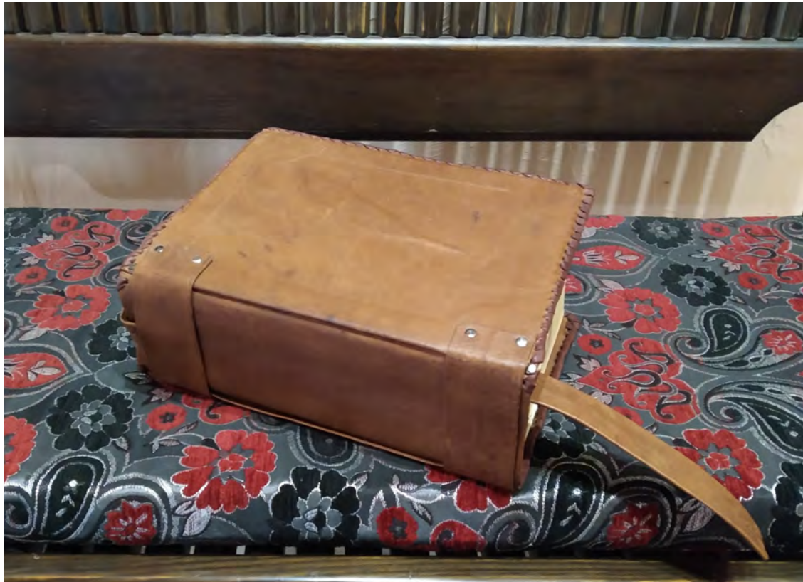
Кніга водгукаў музея-запаведніка, якая захоўваецца ў музейна-выставачным комплексе