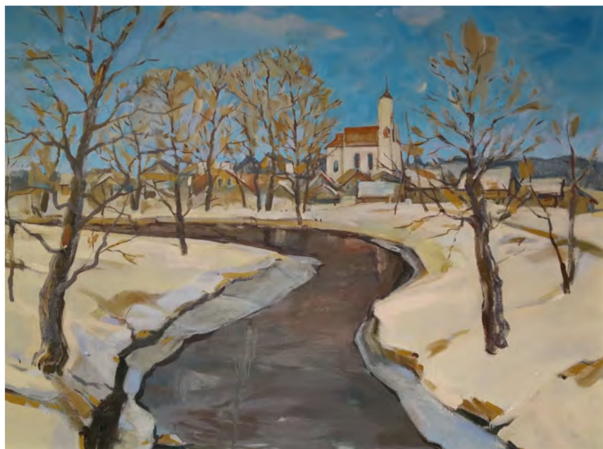
Віктар Данілаў, “Заслаўе. Сакавік. Рака Чарніца”, 2019 г.; памеры крыху зменены, у выніку тэхнічнай абрэзкі выявы

З дапамогай Віктара Мікалаевіча Заслаўе было чарговы раз упісана ў беларускую мастацкую культуру, дзе яго працы займаюць асобную, заўважную старонку. Але, яшчэ выдатнейшым з'яўляецца тое, што творца не спыняецца і працягвае свае пошукі ў галіне заслаўскай тэматыкі, таму маем чакаць на новыя работы – плён гэты яшчэ будзе памножаны на талент і шчырую працу.